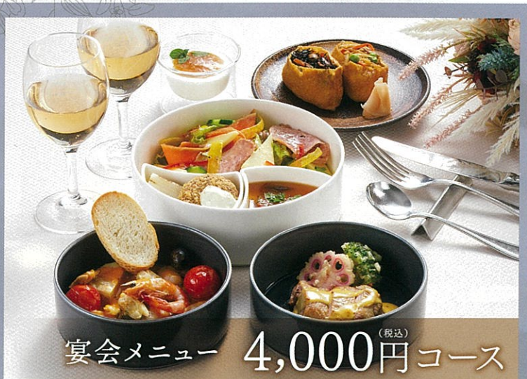
宴会メニュー 4,000円コース (税込)