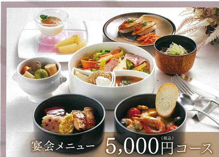
宴会メニュー 5,000円コース (税込)